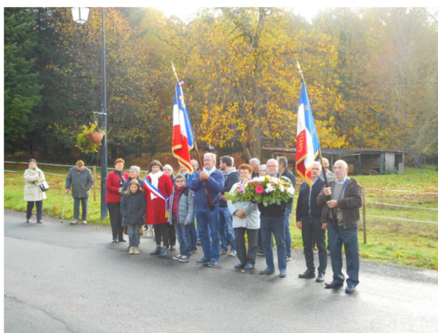
Place de l'église